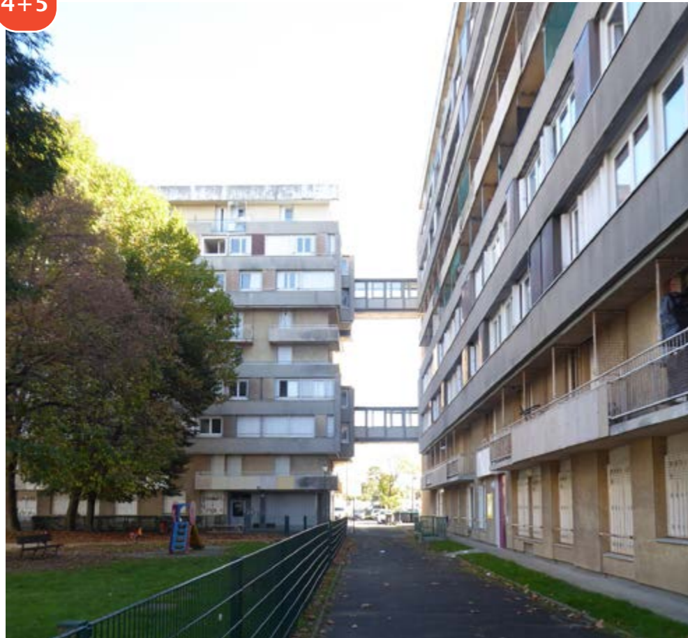
4+5 Deux barres de logements