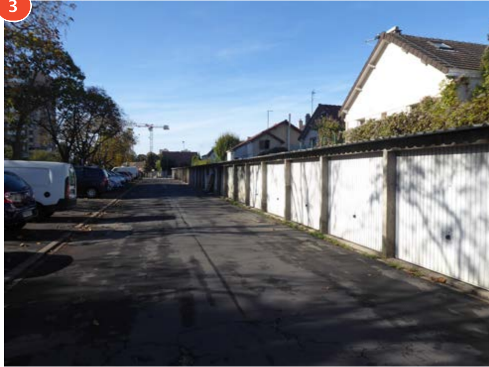
3 box fermés