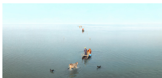
Buffles au travail sur l'estran, 2020 © Yang Shun-Fa