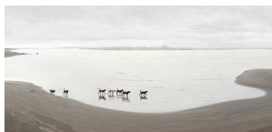
Chiens « To Go » n°6, 2020 © Yang Shun-Fa