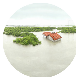
Rivière Jishui, Beimen, ville de Tainan, 2018 © Yang Shun-Fa