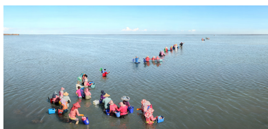
Pêcheurs de palourdes, Embouchure de la rivière Zhuoshui, 2020