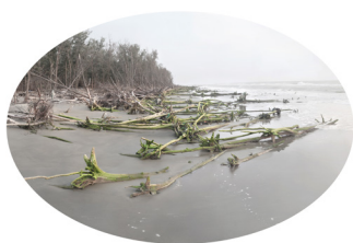
Canton de Qigu, comté de Tainan, 2015