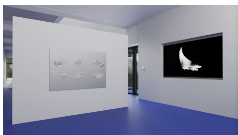
LN_PreviewAccrochage_012 © François Bellabas et Benjamin Roulet