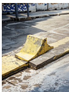
Invocated Spot-002