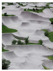
Curvyscape-002 © François Bellabas et Benjamin Roulet