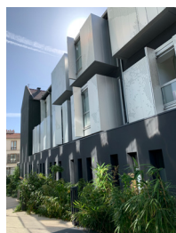
Le Lavoir Numérique, façade historique © Arteo architectures - Cécile Septet