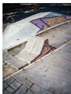
Invocated Spot-001