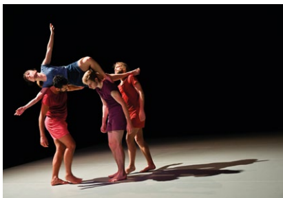
Abaca ©Barolite Faillon

Chorégraphie Michaël Phelippeau Avec Lou Cantor Musiques : extraits des Folies d'Espagne et Air pour Madame la Dauphine Lully / extraits de Folia variations sur un thème de Corelli Rachmaninov Création lumière, scénographie Abigail Fowler Costumes Clémentine Monsaingeon